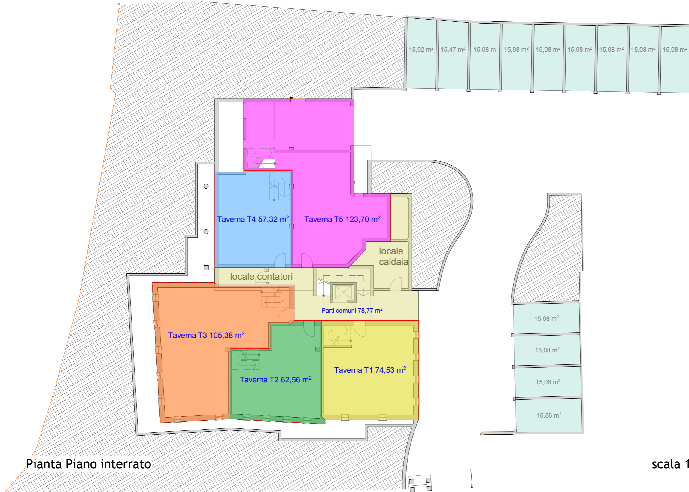
Pianta Piano interrato

La proprietà e i diritti d'autore sono riservati a norma di legge. La pubblicazione o divulgazione può avvenire solo previo consenso